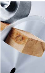
Corte de largos y anchos