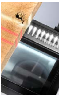
Scannerizzazione / ottimizzazione