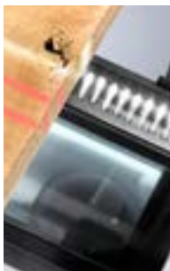
Сканирование / оптимизация