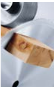
продольный и поперечный раскрой