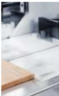
склейка по пласти