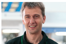
Kuno Zwerger Affûteuses / Outillage Moulurières / Software