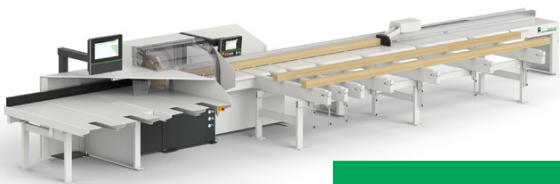
Troncatrice a spintore OptiCut S 50+

Dimostrazione dal vivo di una troncatrice a spintore ad alto rendimento con accatastamento automatico mediante robot per la produzione di pallets, completamente automatizzata. Composizione dell'impianto: OptiCut S 90 con aggregato per il taglio a larghezza wFlex+, stazione di selezionatura e accatastamento automatico.